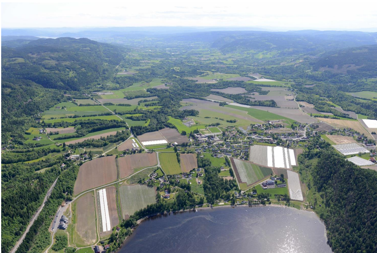
Figur 1. Sylling sett fra nord med Holdsjøen i forgrunnen Foto: Lasse Tur, 2012

Jordvern er også viktig for å bidra til globale bærekraftsmål, og dokumentet fremhever behovet for å bevare jordens fruktbarhet og sikre matsikkerhet for kommende generasjoner.