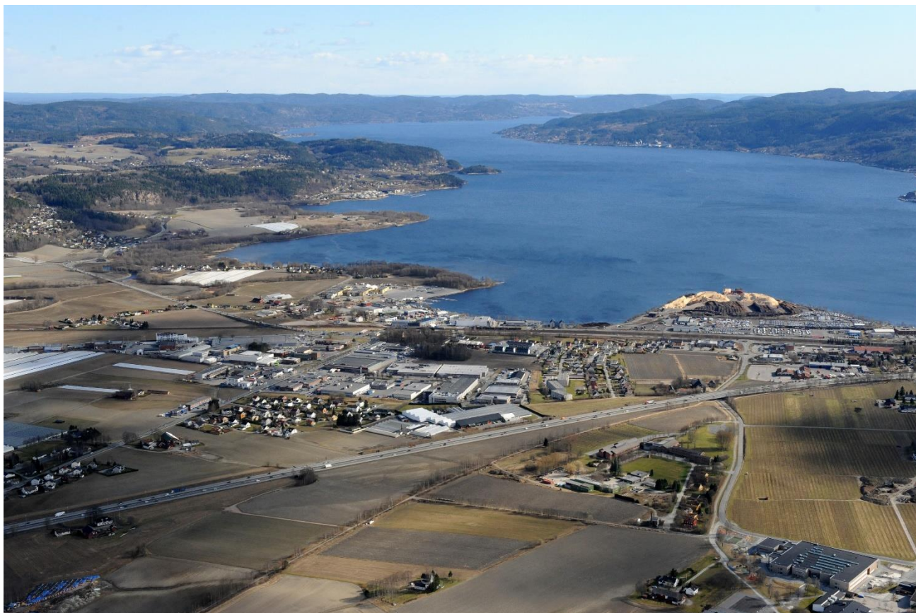
Figur 2. (Lier sett fra oven, 2012)

utenfor fulldyrka jord om mulig. Driftsbygninger må være nødvendige basert på eiendommens areal og drift, ikke eierens subjektive oppfatning. Bygninger for lagring og bearbeidelse av egne planteprodukter regnes som jordbruksproduksjon, men ikke salgsbygninger. Drivhus regnes som jordbruksproduksjon hvis jorda brukes direkte.